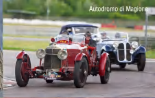
Autodromo di Magione