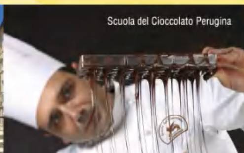
Scuola del Cioccolato Perugia